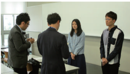
記者からインタビューを受ける学生

また、本講演には新聞大手2紙の取材が入り、公演終了後に聴講した学生2名にインタビューを実施。後日、講演の様々とともに掲載されました。